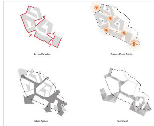
Bsp. Picto (schmidt hammer lassen)