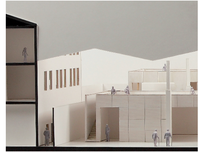
Modell M1:50, Masterthesis von Robert Heß

Bearbeiten Sie die Aufgabenstellung zum einen zeichnerisch, zum anderen in Form eines Modells.