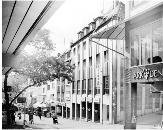
Ehemaliges Modehaus Bender in der Kölner Straße

Ziel des Entwurfes ist es, für die Falke-Geschäfte ein neues Konzept für die Außen- und Innenraumgestaltung zu entwickeln. Das neue architektonische Gestaltungskonzept soll die wesentlichen Merkmale des Unternehmens bündeln und als Grundlage für weitere Umbauten und Neubauten dienen.